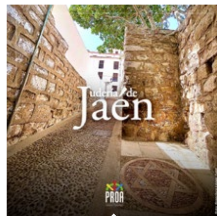
LA JUDERÍA, Jaén