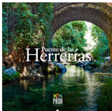
PUENTE DE LAS HERRERÍAS, Cazorla