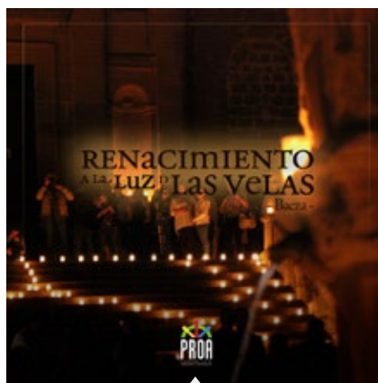
RENACIMIENTO A LA LUZ DE LAS VELAS, Baeza