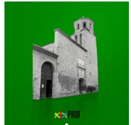
Iglesia de la Magdalena.