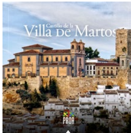
Castillo de la Villa de Martos