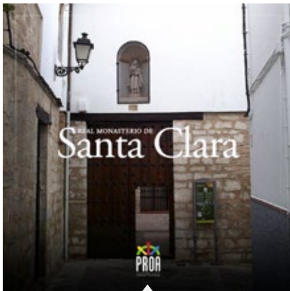
Real monasterio de Santa Clara.