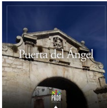
Puerta del Ángel (Jaén)