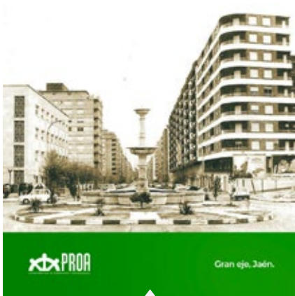
Gran Eje (Jaén)