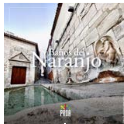
Baños del naranjo