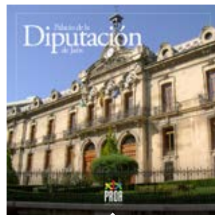
Palacio de la diputación de Jaén