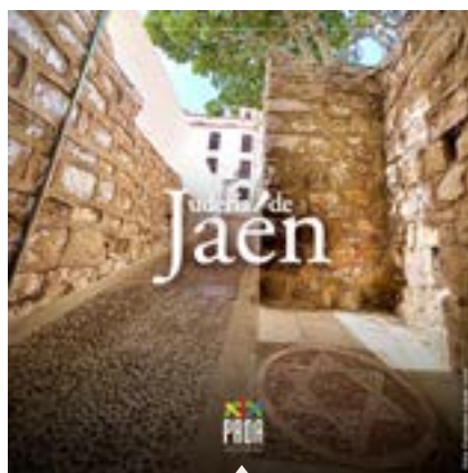
Judería de Jaén